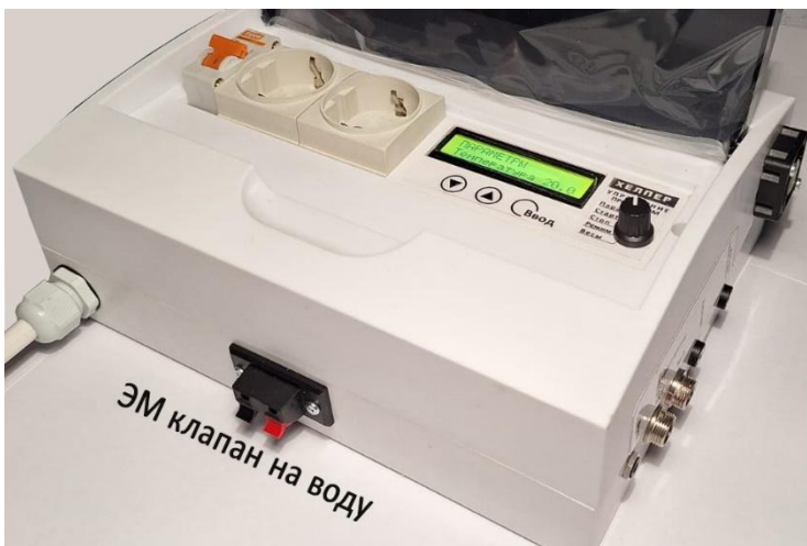
Рис.3. Подключение ЭМ клапана. для подачи воды

Отбор Тела будет продолжаться до момента увеличения температуры спиртовой полки на 0,1 градуса или на то значение, которое Вы ввели в «Параметры», «Дельта t». Автоматика останавливает отбор, ожидает возвращения температуры на спиртовую полку, делает короткую стабилизацию полки и уменьшив скорость отбора открывает электромагнитный клапан. Отбор продолжается. Окончательное завершение отбора ректификата происходит, когда текущая температура не вернулась на температуру спиртовой полки более чем за 10 минут.